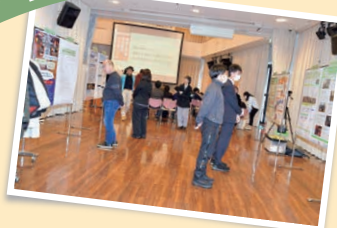
昨年の発表の様子